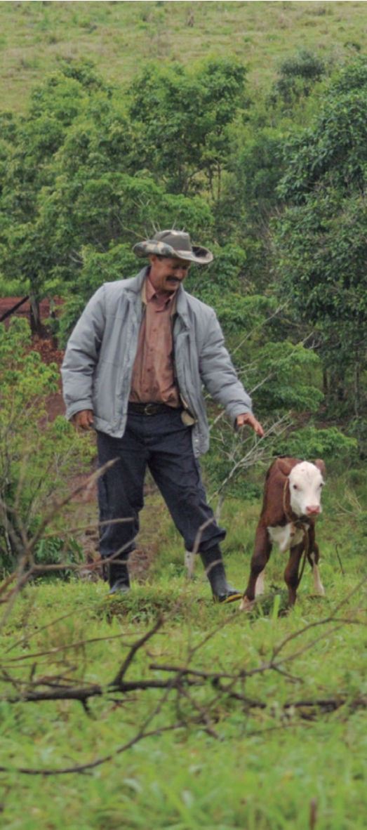
Productor de Pozo Azul

Durante las jornadas de trabajo el equipo técnico y administrativo del Instituto Nacional de Colonización capacitó a representantes de la Dirección Nacional de Tierras y Unidades Agropecuarias en las siguientes temáticas: presentación de la Institución, funcionamiento, marco normativo, proceso de planificación de la colonización, proceso de selección de colonos/as.