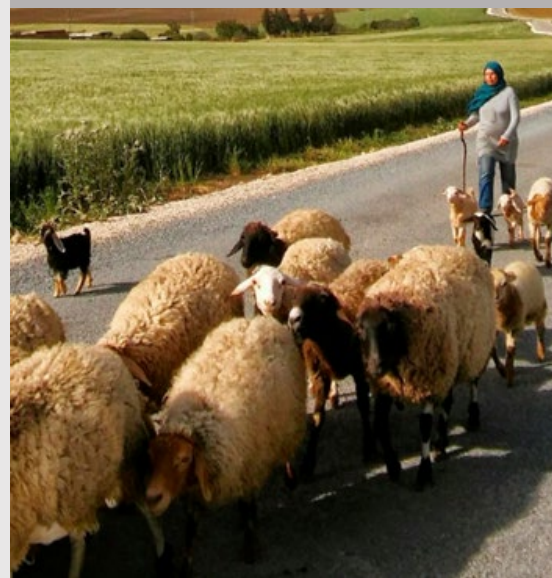
Misión de intercambio técnico a campo de los profesionales del INTA.