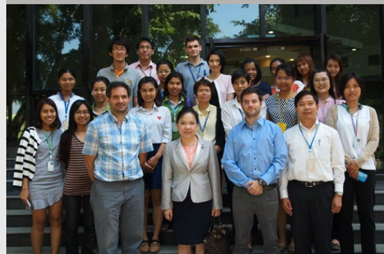
Visita de profesionales de SAGYP al Centro Nacional de Ingeniería Genética y Biotecnología de Tailandia