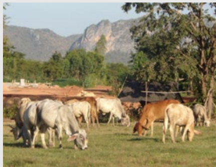
Misión de intercambio técnico a campo de los profesionales del INTA