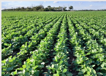
Visita de técnicos tailandeses a la Estación Experimental Agropecuaria de Marcos Juárez del INTA