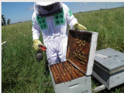
Misión de intercambio técnico a campo de los profesionales del INTA.