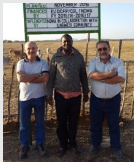
Misión de intercambio técnico a campo de los profesionales del INTA.