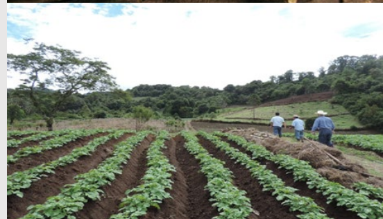
Misión de intercambio técnico a campo de los profesionales del INTA.