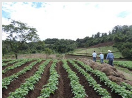
Misión de intercambio técnico a campo de los profesionales del INTA