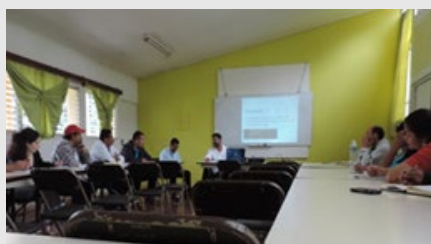
Taller de capacitación impartida por los profesionales del INTA