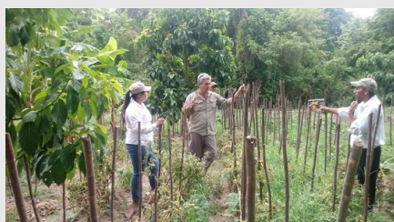
Misión de intercambio técnico a campo de los profesionales del INTA.