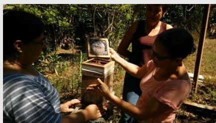
Misión de intercambio técnico a campo de los profesionales del INTA.