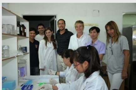
Entrenamiento de profesionales del CARDI en la Estación Experimental Agropecuaria de Concepción del Uruguay del INTA