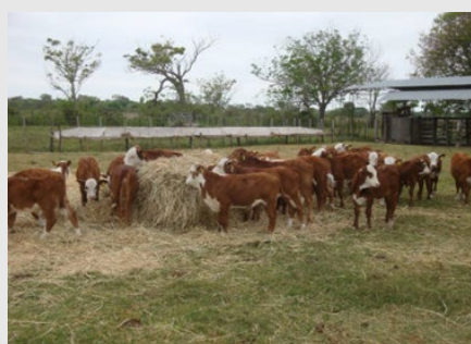
Visita de los profesionales del DAHP y del NAFRI a las Estaciones Experimentales Agropecuarias del INTA