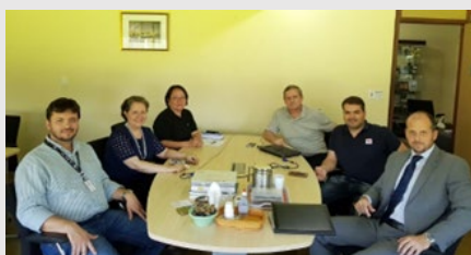
Taller de intercambio técnico entre los profesionales del INTA y EMBRAPA