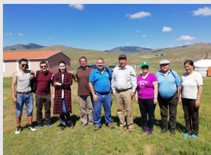
Misión de intercambio técnico a campo de los profesionales del SENASA y el INTA.