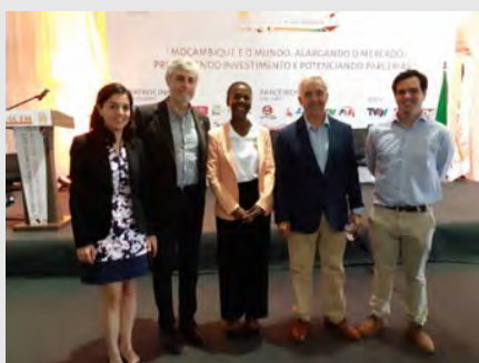
Misión de capacitación técnica impartida por los profesionales del INTA