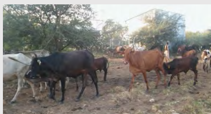
Misión de intercambio técnico a campo