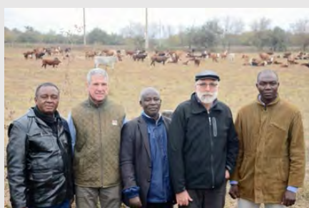
Visita a campo de profesionales nigerianos al Centro Regional Chaco-Formosa del INTA