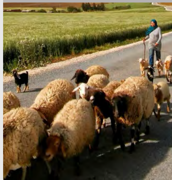
Misión de intercambio técnico a campo de los profesionales del INTA.