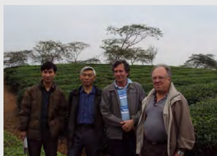
Misión de intercambio técnico a campo de los profesionales del INTA