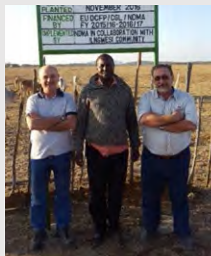
Misión de intercambio técnico a campo de los profesionales del INTA.