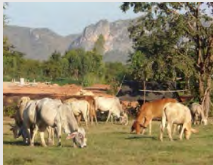
Misión de intercambio técnico a campo de los profesionales del INTA