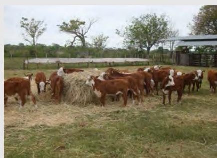
Visita de los profesionales del DAHP y del NAFRI a las Estaciones Experimentales Agropecuarias del INTA